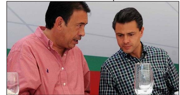
Peña y Moreira...Muchos consideran un error haber abierto puertas del PRI a la Gordillo...