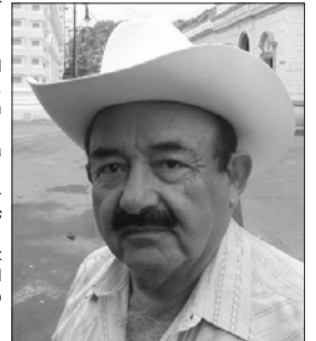
López Luna... Amenaza y dice que él podrá orden en la procu, ¿acaso y Abel no lo hace?...