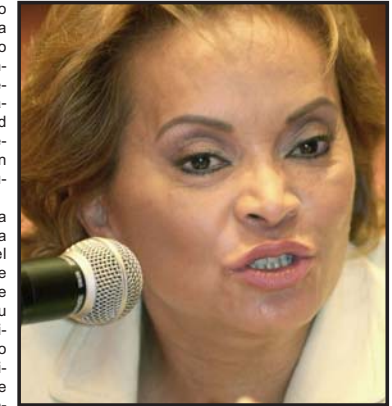
Gordillo...Priistas no se explican alianza con quien operó contra su partido...

Además, no se corresponde con este pragmatismo radical demostrado en las alianzas con el Verde y el Panal, que desde las mismas oficinas de la "nueva generación de priistas" se siga fomentando y tolerando la hostilidad contra los "viejos priistas", a quienes quieren segregar de las posiciones en las Cámaras culpándolos malévola-